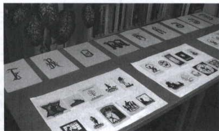
Výstava „vystříhovaných siluet ex libris“

Ex libris je umělecky provedený štítek se značkou nebo jménem vlastníka knihy nalepený na vnitřní stranu knižních desek. Kdo by neznal tyto knižní značky.