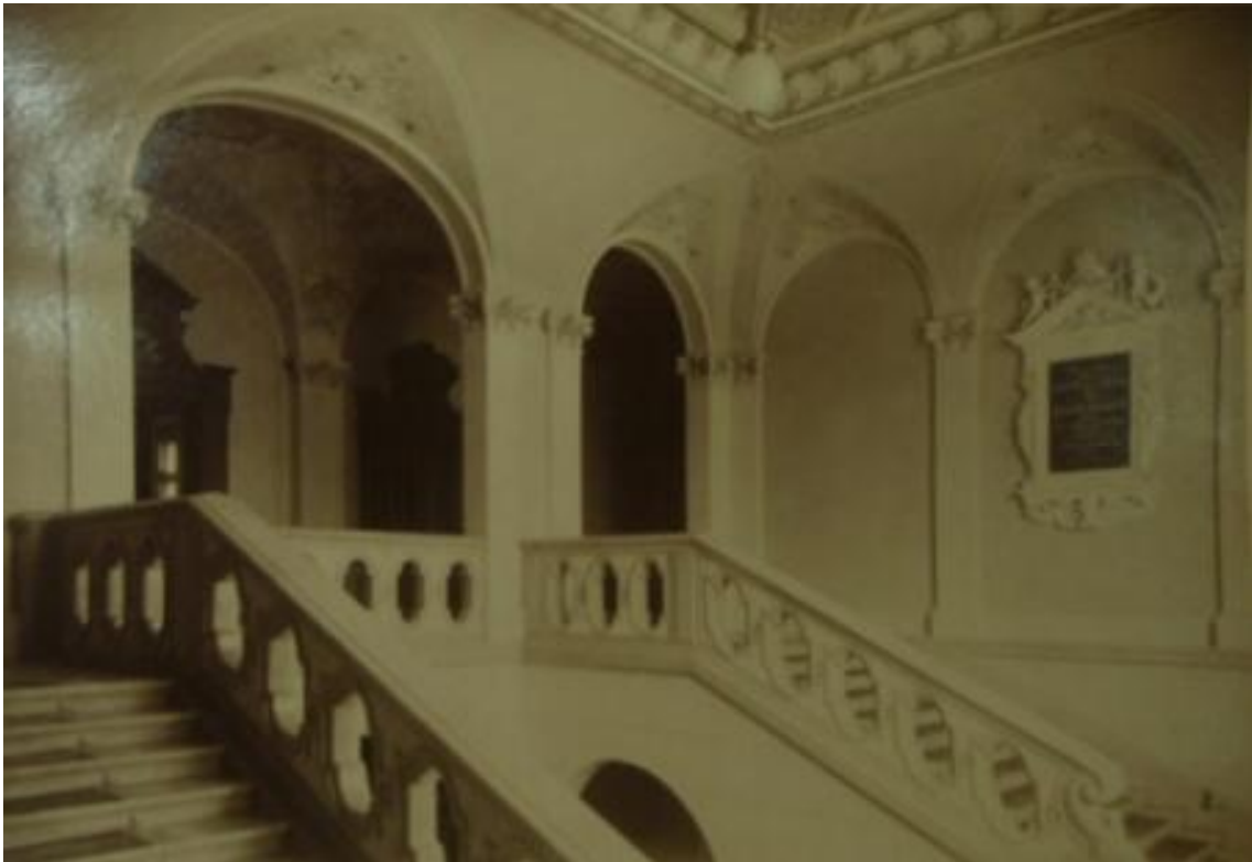
Obrázek C: Schodiště do 1. patra s pamětní deskou k otevření Německého domu