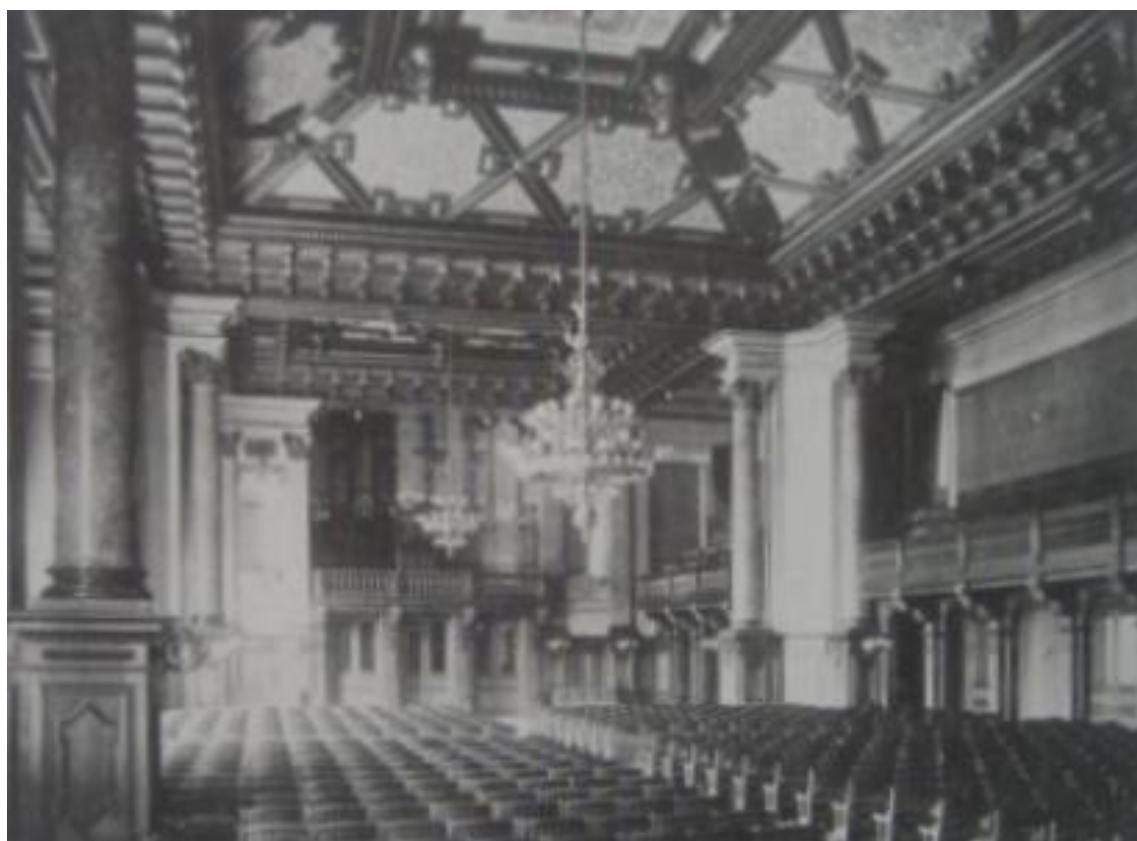
Obrázek F: Velký slavnostní sál