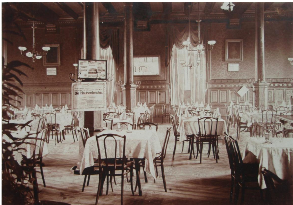
Obrázek E: Kavárna Německého domu