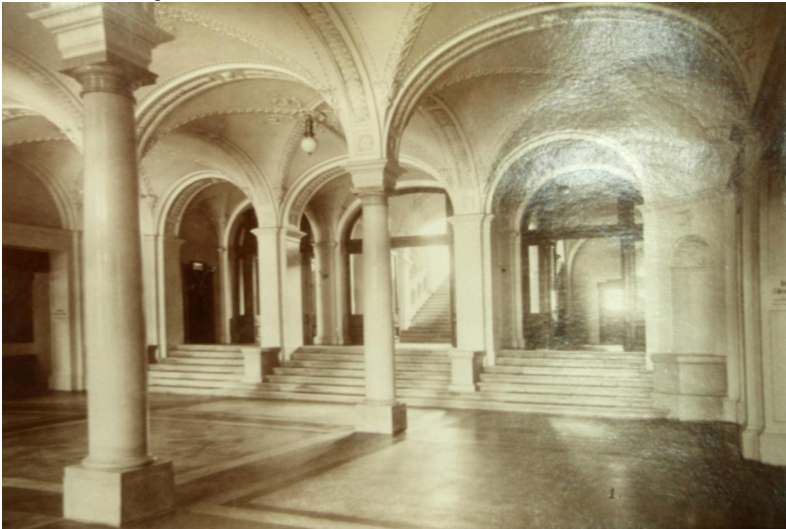
Obrázek A: Vestibul Německého domu