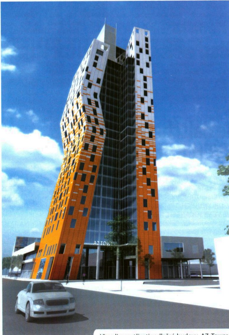
Vizualizace třicetipodlažní budovy AZ Tower, která vyroste v brněnském Jižním centru.