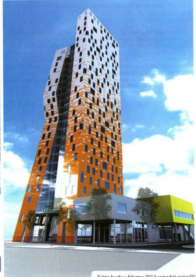
Takto bude v březnu 2013 vypadat nejvyšší budova v Česku.