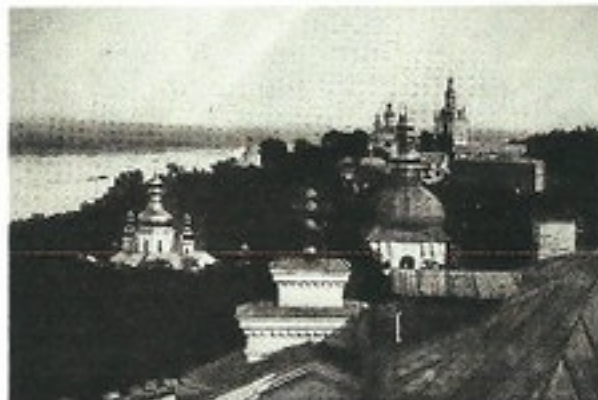
město Kyjev, kolébka Čs legií na Rusi