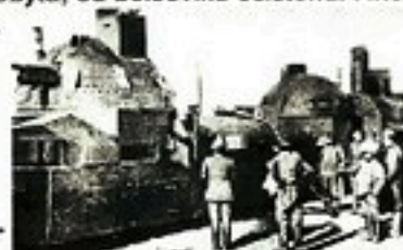
bronírovaný vlak „Orlík“

Po jednodenním oddychu jsme jeli na povozkách do stanice Vagaj na obchvat. Tam jsme dorazili na druhý den ráno. Na stanici boj byl krátký, v půl hodině celé nádraží bylo naše, bylo pokryto mrtvolami nepřítel. Ešalony i rozbitý automobil bronírovaný, zůstal v našich rukou. Nás bylo málo – necelých 300 mužů, byli jsme nuceni se chránit ze všech stran, poněvadž jsme byli 18 verst v týlu nepřítel. Stanice zůstala po 9 hodin v našich rukou, na to nepřítel dověděl se, že jsme byli v jeho týlu, vzal stanici útokem a počal nás ze všech stran obkličovati. Tu nezbylo nám, než buď se probít, nebo čestně zemřít, neb proti patnáctkrát silnějšímu nepříteli, nemohli jsme více dělati. Postavení naše bylo beznadějně. Buď a nebo! Sehnalo se nás 40 lidí s bratrem poručíkem v čele a počali jsme se probíjet. Zuřivě jsme se hnali proti nepříteli, který se toho našeho „URÁ“ hrozně lekl a udělal cestu, kudy jsme šťastně proběhli skrz jejich linii a byli jsme zachráněni. Když jsme se vrátili do ešalonu, již byla stanice dobytá, od bolševiků očištěna. Hned jsme tam jeli a pochováli našich osm bratřů, kteří v tomto boji zahynuli.