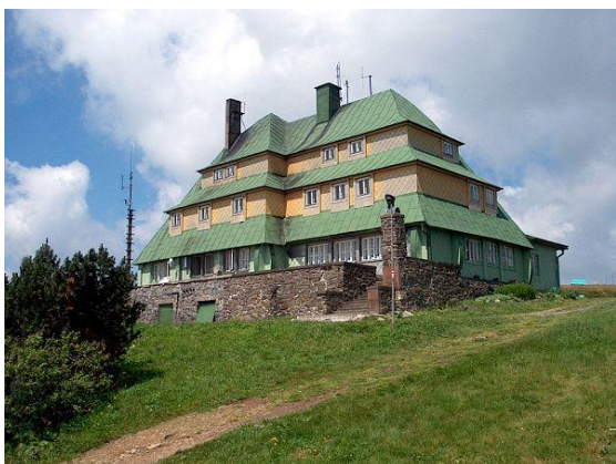
Foto 1 Masarykova chata na Šerlichu