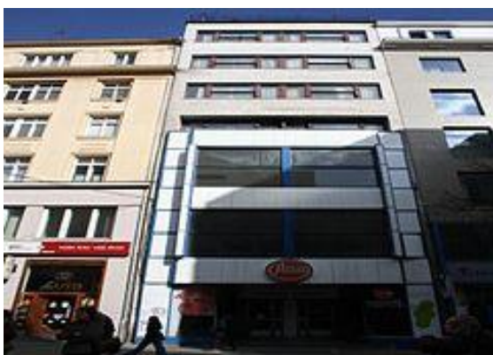
Foto 3 Hotel Avion Brno, Česká ulice