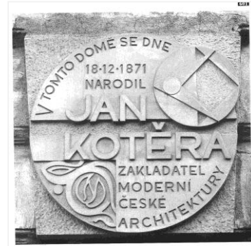
Foto 6 Pamětní deska Brno, Palackého tř.