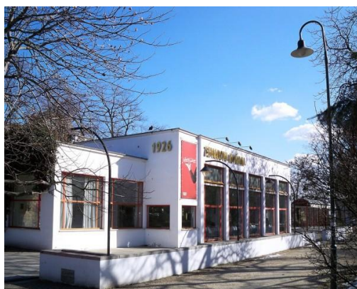
Foto 2 Obnovená Zemanova kavárna Brno